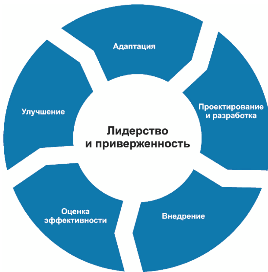
Рисунок 3 - Структура

Организация должна оценить существующую практику и процессы менеджмента риска, выявить существующие недостатки и устранить их в рамках структуры.