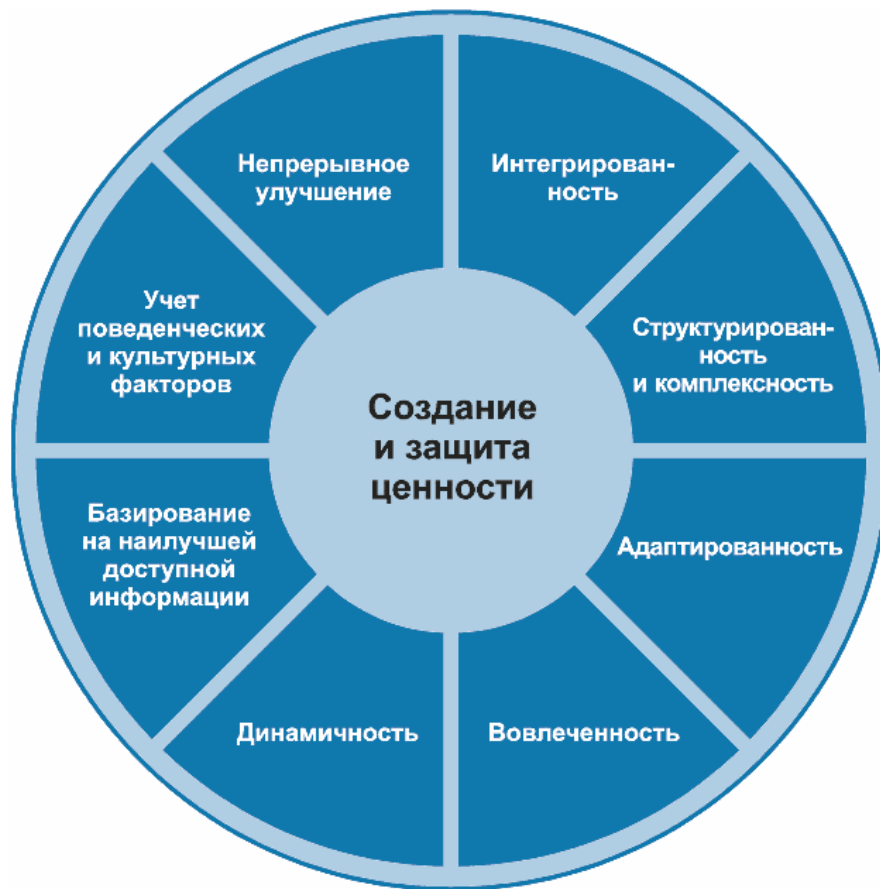
Рисунок 2 - Принципы

Принципы, представленные на рисунке 2, устанавливают характеристики эффективного и результативного менеджмента риска, отражают его ценности и объясняют его назначение и цель. Эти принципы являются основой менеджмента риска и должны учитываться при создании структуры и процесса менеджмента риска организации. Соблюдение принципов позволит организации управлять влиянием неопределенности в отношении достижения целей организации.